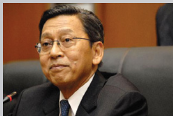
Boediono 博士(教授), 1972年 获经济学硕士学位